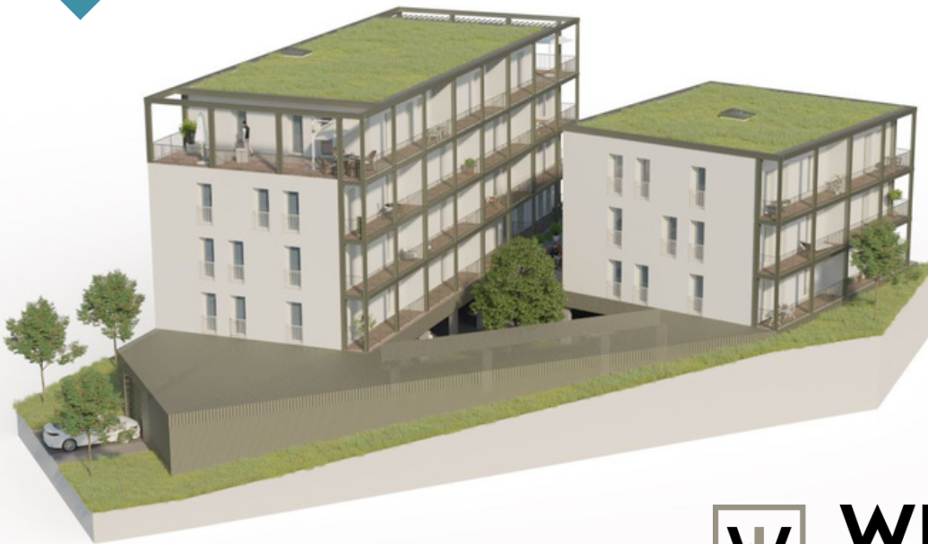
Virtualisierung des Projekts Taläcker in Künzelsau

Wie Werner Neubauimmobilien Interessenten effizienter qualifiziert und Immobilien schneller vermarktet